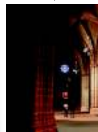
Publicada por Naoto en Picasa.